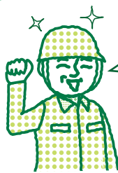
飲料工場 配送管理者

現場でガラス瓶詰めの商品をフォークリフトで運んでいると、衝撃で瓶が割れてしまうことも。グッドランニングシステムを導入したら、驚くほど破損が無くなり、気遣った運転をしなくても、製品を大切に運ぶことができるようになりました!