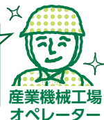
産業機械工場 オペレーター

扱ひものの種類も多いし、壊れないように運ぶので気を遣うし、振動音も大きいので困っていたけど、グッドランが全て解決してくれたよ! ストレスが減り、安全面も良くなったね。