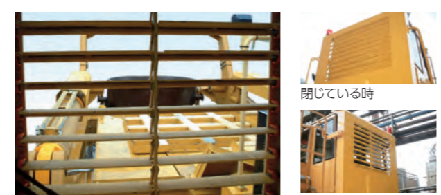
運転席からの視野

鍋からの輻射熱やスラグの飛散防止に、開閉式窓を装備、安全で快適なオペレーター環境を実現します。また、後進および荷役作業時には窓を開き、十分な視界を確保できます。